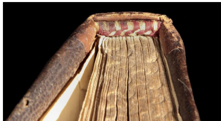
Milano, Archivio Storico Civico e Biblioteca Trivulziana, Cod. Triv. 84 (capitello)